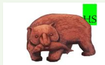
【企業紹介】株式会社北海道なまら札幌